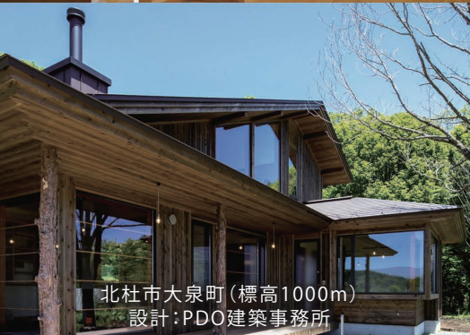
北杜市大泉町(標高1000m) 設計:PDO建築事務所