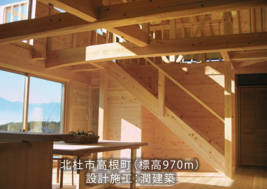
北杜市高根町(標高970m) 設計施工:潤建築