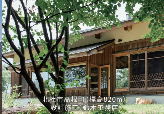
北杜市高根町(標高820m) 設計施工:鈴木工務店