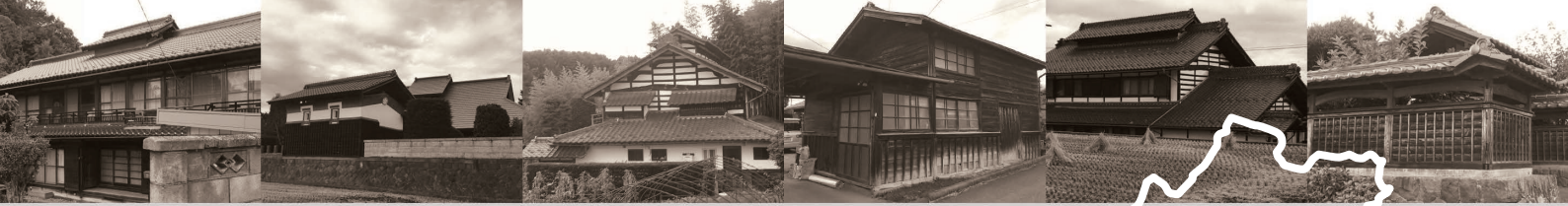
北杜市内の古民家