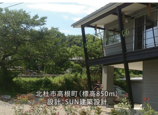
北杜市高根町(標高850m) 設計:SUN建築設計

11月4日(土) 11時~17時 旧平田家住宅 生涯学習センターこぶちさわ 参加費:三〇〇〇円 (建築士会会員・同一事業所の二人目以降は五〇〇円割引) ※五〇〇円で昼の弁当の注文承ります ※懇親会費は別途(二〇〇〇円程度を予定しています) 申込:ネットかFAXで要事前申込(裏面参照) ※先着九〇名様。定員に達し次第、締切ります