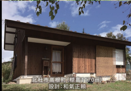
北杜市高根町(標高1170m) 設計:和氣正頼