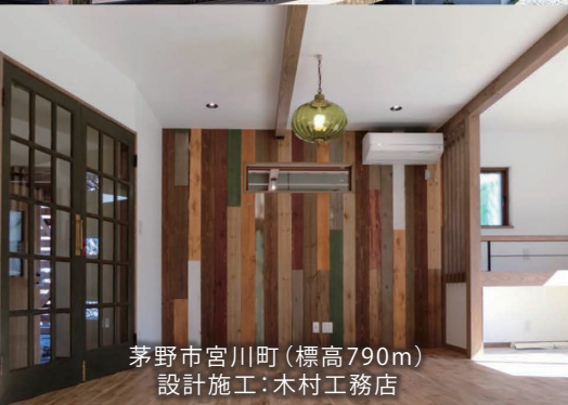
茅野市宮川町(標高790m) 設計施工:木村工務店