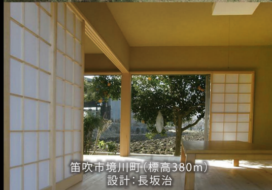
笛吹市境川町(標高380m) 設計:長坂治